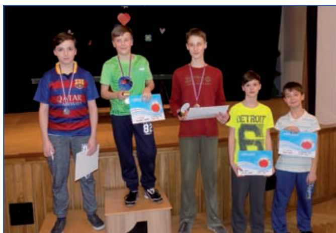
Kategorie starší žáci.