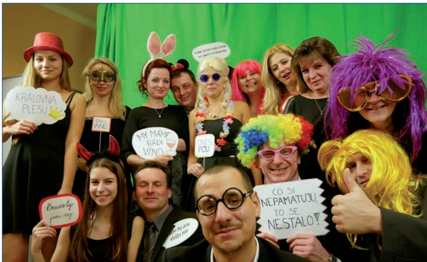
Ples FK Lutonina - fotokoutek.