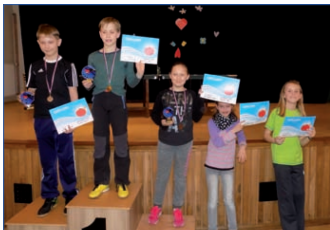
Kategorie mladší žáci.