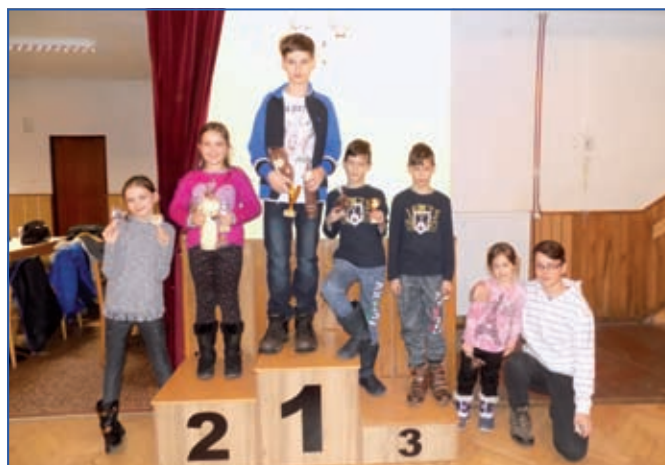
Turnaj „Člověče nezlob se“.