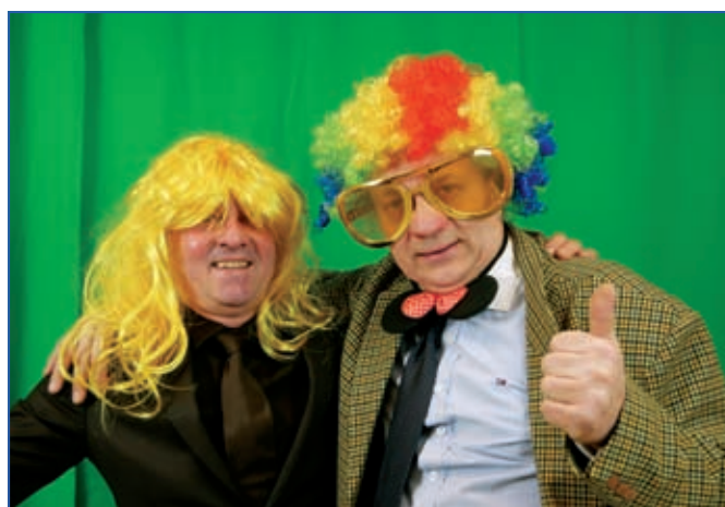
Ples FK Lutonina.