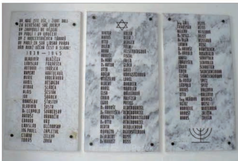
Pamětní deska na Purkyňově gymnáziu ve Strážnici, T. Zrník je na levém panelu dole

Jedna ze strážnických ulic je pojmenována "T. Zrníka".