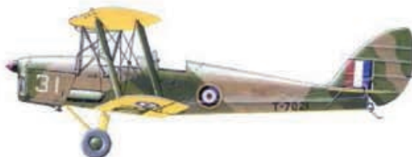
De Havilland DH.82 Tiger Moth Mk.II od 3.EFTS na základně Watchfield (Ilustrovaná historie letectví 8)