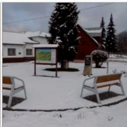
Pamětní deska (evidencev.h.army.cz), Pomník (Facebook obce Lutonina) (desku lze trochu vidět vzadu na budově KD, je umístěna mezi okny)