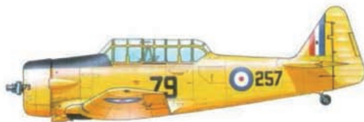
North American Harvard Mk.II (AT-6 Texan) od 34. SFTS na kanadské základně Medicine Hat (V. Šorel: Češi a Slováci v oblacích)