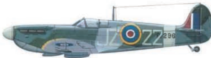
Supermarine Spitfire IIa P7296 (JZ-22) používaný u 57. OTU v roce 1942 (Z. Hurt: Supermarine Spitfire Mk. I - II)

Mezi učitele T. Zrníka patřil i L. Šrom, pozdější stíhací eso s osmi potvrzenými sestřely.