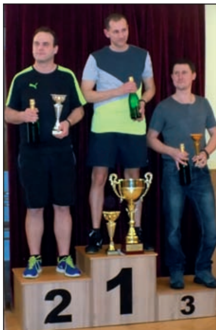
Muži stupně vítězů.

V neděli se postavily za stoly děti. Účast byla hojná. Navštívili nás hráči z okolních vesnic a dokonce i ze Zlína a z Veselého. Mladší žáci, kte-