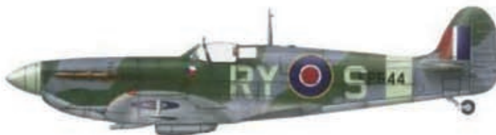
Znak 313. čs. stíhací peruti, Supermarine Spitfire Vb EP644 (RY-S) používaný u 313. na jaře 1943 (J. Rajlich: Na nebi hrdého Albionu 4)