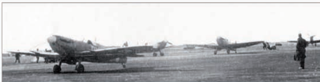
Spitfire Mk.Vb od 313. čs. stíhací peruč rolují na start, období 1942/1943 (F. Fajtl: Velel jsem stíhačům) (pro ilustraci)