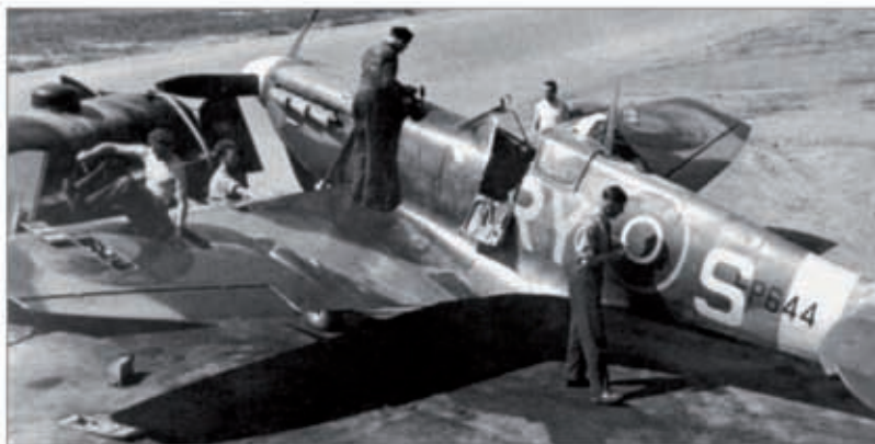
Supermarine Spitfire Vb EP644 (RY-S) v péči mechaniků, Churchstanton, květen 1943 (Z. Hurt: Češi a Slováci v RAF za druhé světové války)

Piloti začínající u operační peruti obvykle procházeli úvodním seznámením s technikou, cvičnými lety, navigací v okolí a podobně. Poté byli posíláni na bojové úkoly.