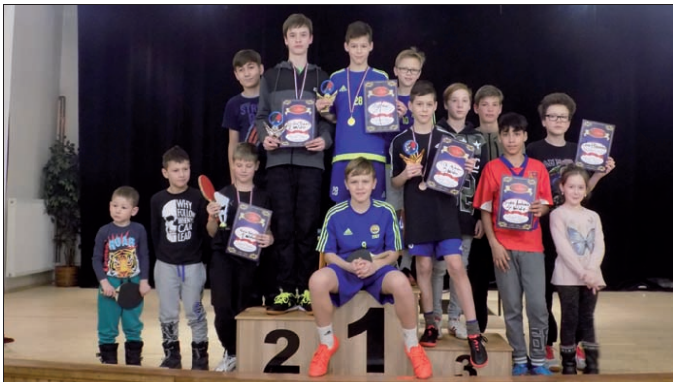
Děti, hromadná fotka stolní tenis.